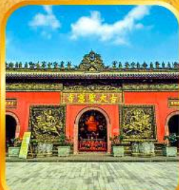
วัดต้าอื่อ