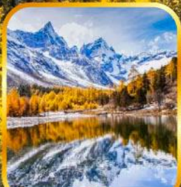
อูทยานปี้เผิงโกว

เที่ยว 2 อูทยาน ระดับ 4A , 5A หมี่แพนด้านอนเซลฟี ตุเจียงเยียน ซ้อปปังซุนซีลู่