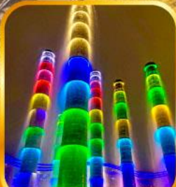
ชมไฟน้ำพุไม้ไฟตึก SKP