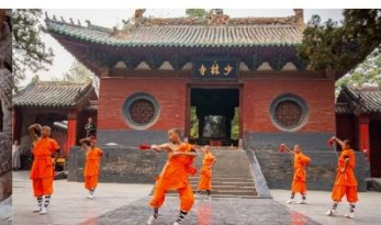
ชมโชว์กังฟูเส้าหลิน

*ทางบริษัทฯ ขอสงวนสิทธิ์ในการสลับโปรแกรมทัวร์ตามความเหมาะสมขึ้นอยู่กับสถานการณ์หน้างาน โดยคำนึงถึงผลประโยชน์ของลูกค้าเป็นสำคัญ