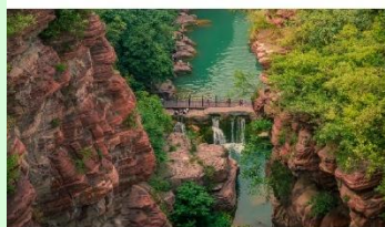
อุทยานสวรรค์หยุนโตซาน